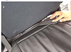
写真7と同様に押し込みますが、シートベルト用のゴムフックがありますので、出しておきます。